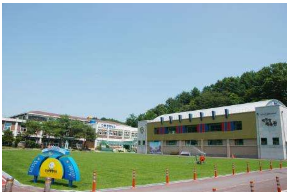
安東永明学校の全景