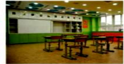
教科専用教室 - 国語教室