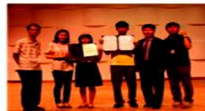
自己権利主張大会2連破