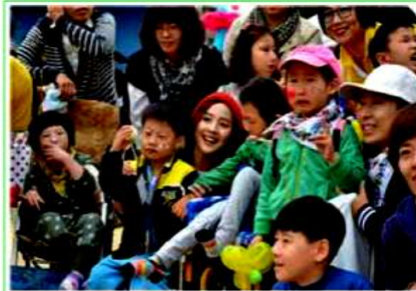
本校の広報大使元アイドル-YUJIN