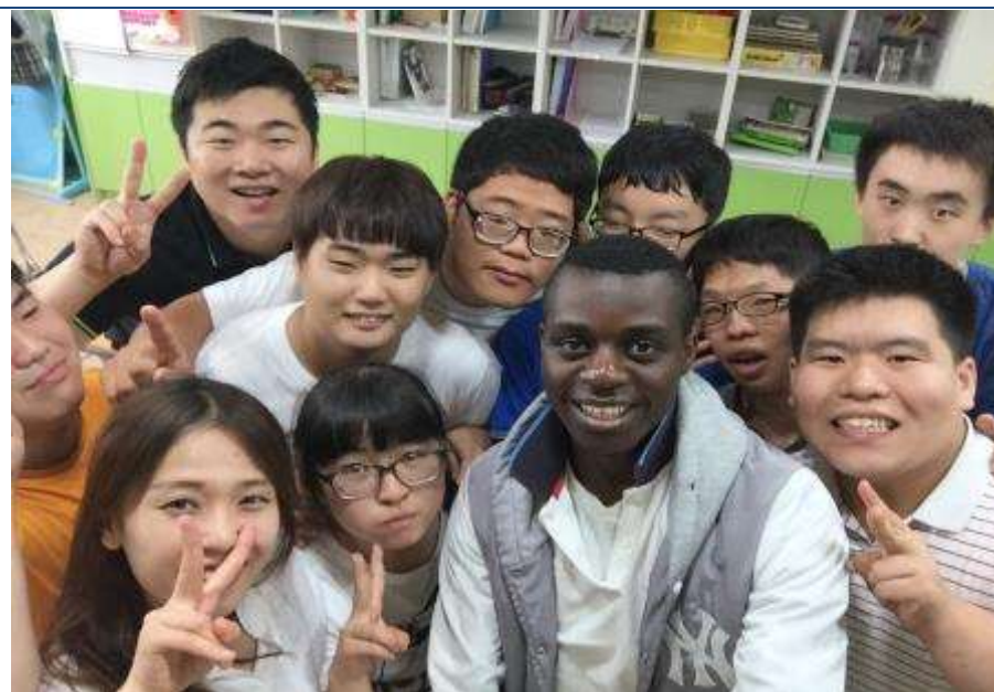
ユネスコ協同学校(国際理解教育)