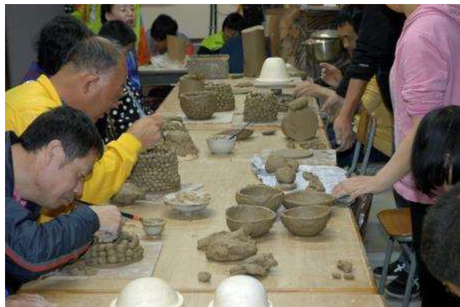
専攻科(未就学高齢者も対象)の窯業指導