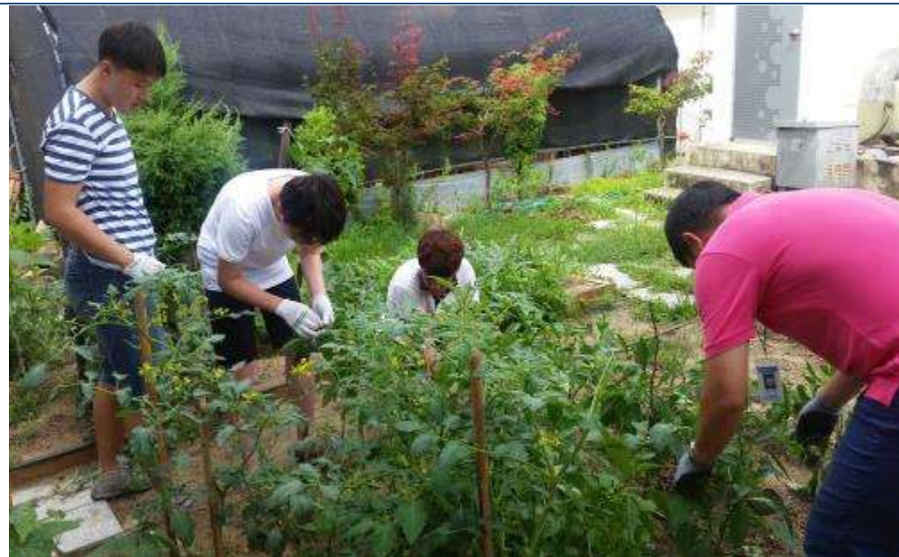
高等部の園芸指導