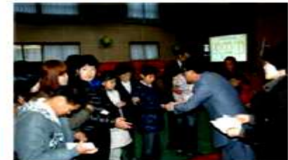
新入生全員奨学金支給