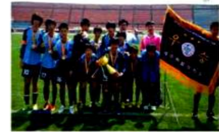
サッカー部 2011年全国大会4連覇.