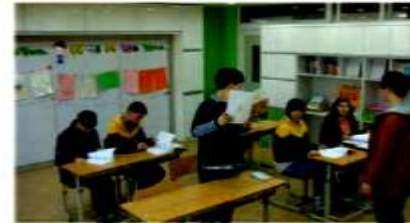
教科専用教室 - 科学教室